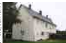
Avant/après d'un petit collectif à Marmagne (18) rénové et isolé par une seule et même opération grâce à la pose du K'ITE System d'Hylor, revêtu ici d'un bardage en Pin maritime autoclave classe 3 vert.

réagencement des pièces, changement des éléments de décoration (peinture, papier peint..), et pour finir, et non des moindres : la perte de mètres carrés occasionnés par une isolation «intra-muros» !